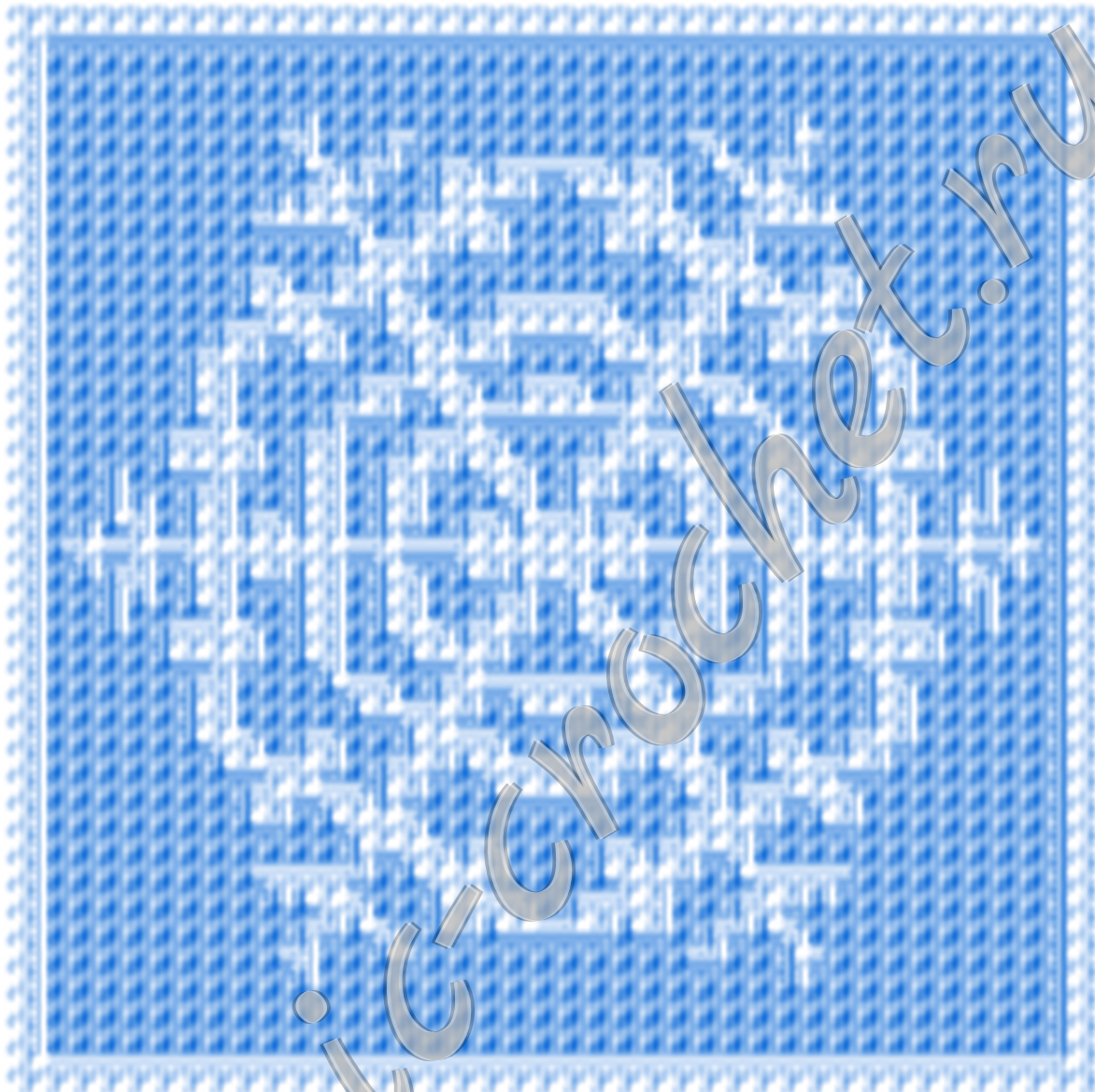
Схема мозаичного вязания «Снежинка» Размер 81x81