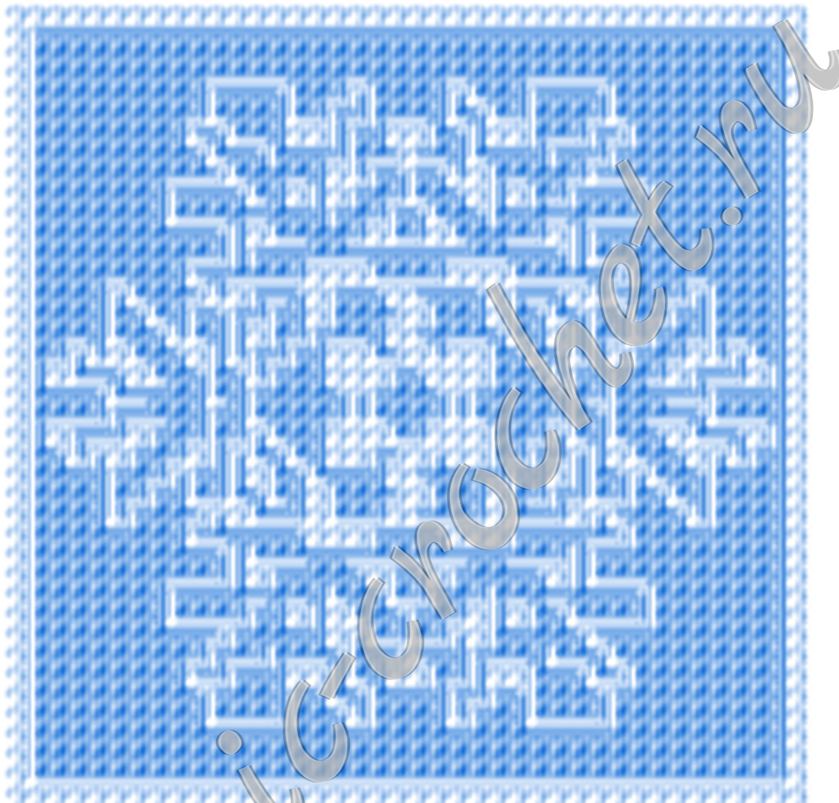
Схема мозаичного вязания «Снежинка» Размер 81x81