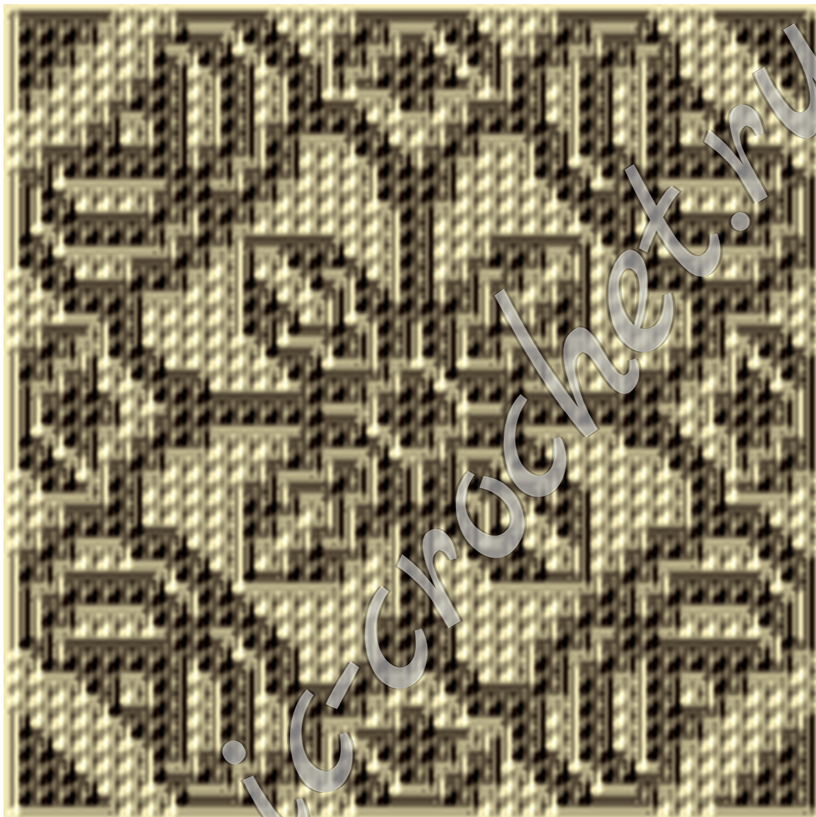
Схема мозаичного вязания «Подушка с орнаментом» Размер 73x73