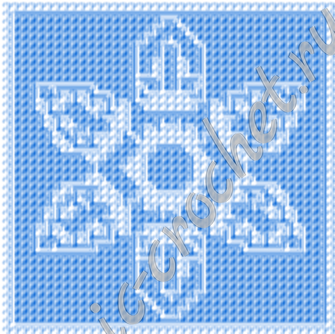
Схема мозаичного вязания «Снежинка» Размер 81x81